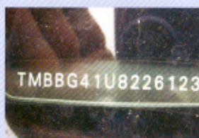
VIN sklo padělek

Zákazník: Jaké jsou nejčastější právní vady vozidel, zjištěné při dokladovém prověření?