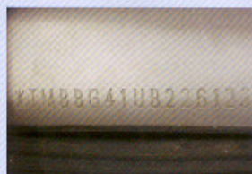
VIN karoserie – ražba padělek