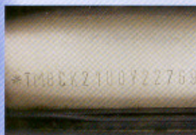
VIN karoserie – ražba originál

Padělané identifikační znaky se od originálů někdy liší jen v detailech, které dokáže odhalit jen odborník vybavený speciálními detekčními přístroji.